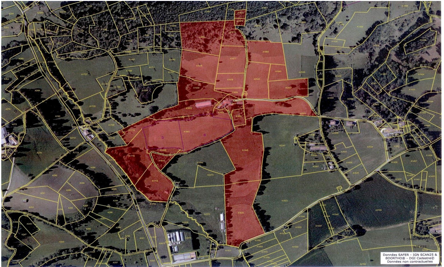
Parcelles Cadastreales des Bâtiments et des Prairies : 20 ha.