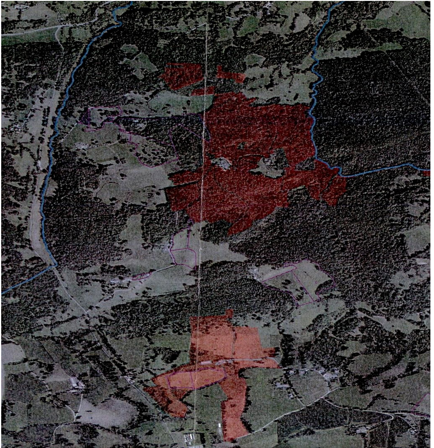
Vue Satellite de l'ensemble des Terres

Copie : “Cardouech - 09240 Rimont” et colle dans : Géoportail